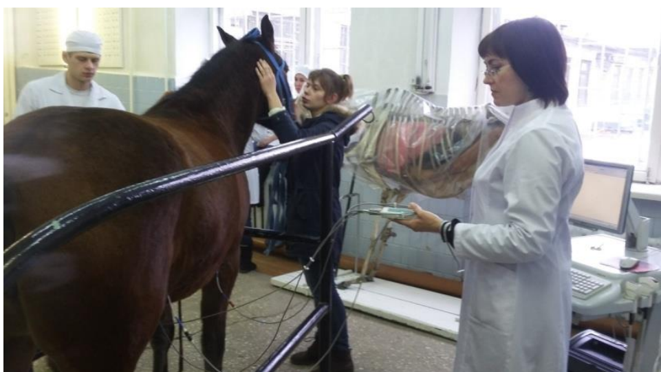
Проведение электрокардиографического исследования лошади