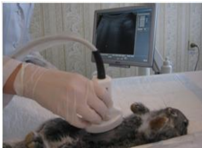
Проведение ультразвукового исследования органов брюшной полости кролика