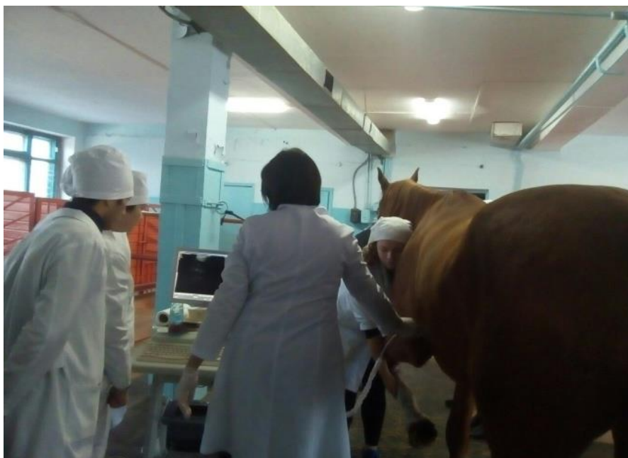
Проведение ультразвукового исследования сердца лошади