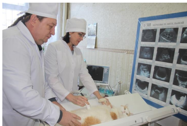
Проведение ультразвукового исследования органов брюшной полости кота