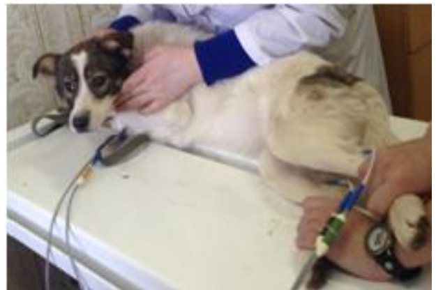
Проведение электрокардиографического исследования собак